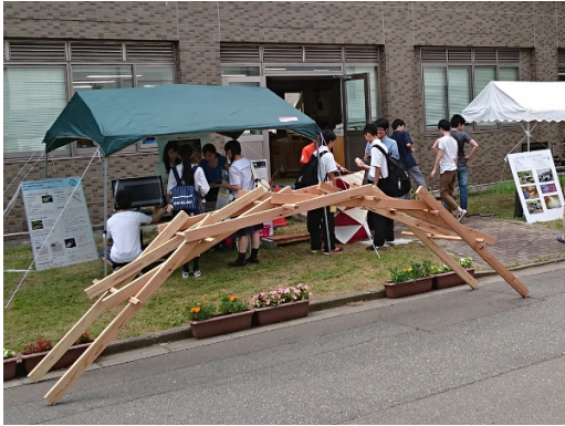
オープンキャンパス 2018 の虹橋