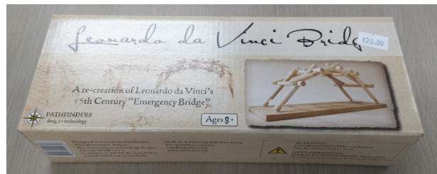
イタリアの「ダビンチの橋」