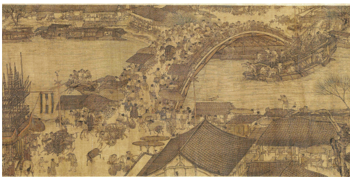
清明上河図の虹橋