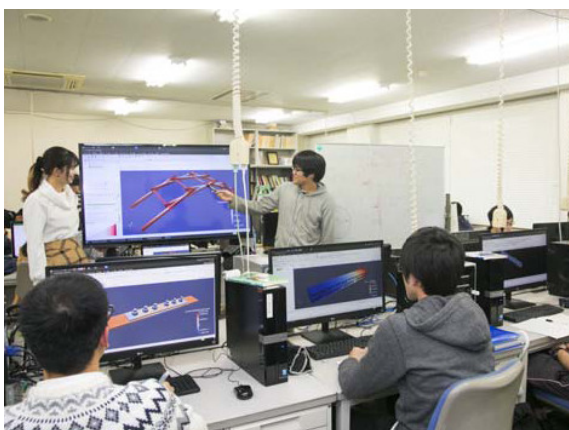
図4 Salome-Meca の実習中の学生たち

シミュレーションによって解析する手法にも力を入れています。数値シミュレーションには、フリーのツールだけで汎用ツール並みの高度な構造解析(有限要素解析)を行えることも模索していて、Salome-Meca, CalculiX など(プログラムが公開されている)オープンソースのツール群を活用しています。こうしたCAE(computer aided engineering)ツールは様々な意味で、Windows よりも Linux という OS(Android の元になっている OS)の方が相性がよく(OSのライセンス料を節約したいという意味もありますが)、わたしたちの研究室では、Windows に限らず、Ubuntu などの Linux OS も活用しています。