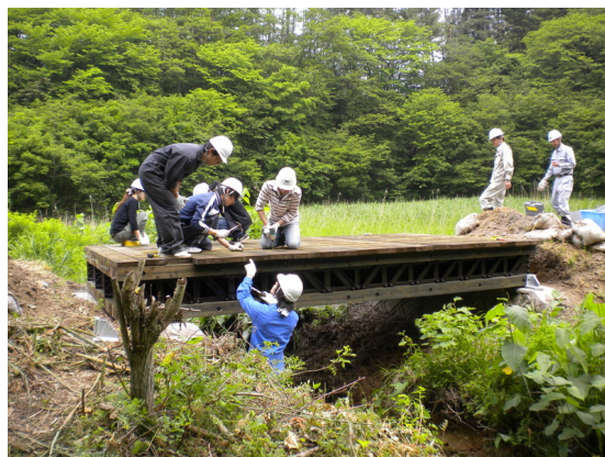
図1 オンサイト木橋の施工を手伝う学生たち

さて、当初は間伐材の有効利用から着想したオンサイト木橋ですが、これは簡単に組み立てられ、廃材や瓦礫なども利用で