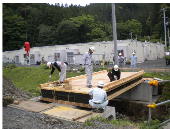
図2 大槌町架設住宅前へのオンサイト木橋の架設

きなくはないため、災害時の応急橋としても適しているのではないかということになりました。そこで、2012年7月に、岩手県大槌町の仮設住宅前に歩道橋としてオンサイト木橋を試験架設しました。木橋の弱点の1つは、屋根のある木造建築とは違い、雨水や湿気により腐りやすいということですが、短期間の使用を前提とした応急橋の場合、その木橋の弱点を気にせず、木材の利点(比強度が高く、軽い割に丈夫)を最大限に活かした構造も採用できます。そこで現在は、オンサイト木橋を更に応急橋の用途に特化させ、手で持ち運べる材料(合板や角材)だけで組み立てられる新たな橋梁形式を秋田県立大学や業者の方たちとともに開発しています。