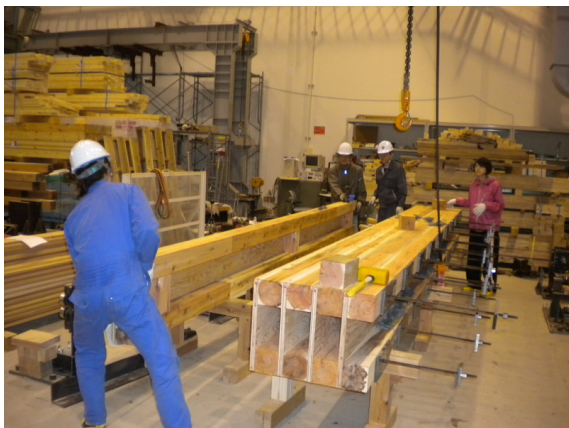
図3 応急橋の組立を行う学生たち